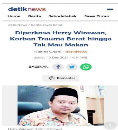
Gambar 1. 2

Menurut Uu Ruzhanul Ulum selaku Gubernur Provinsi Jawa Barat berpendapat dengan tegas bahwa pondok pesantren dengan boarding school terdapat perbedaan yang signifikan. Ciri khas dari pondok pesantren menggunakan kitab kuning selama proses kegiatan belajar-mengajar (KBM), hal tersebut berlaku untuk semua pesantren, tidak hanya yang santrinya tinggal di asrama. Sedangkan untuk di asrama, santri tidak disuguhkan dengan pelajaran kitab kuning (Maliana, 2021). Selain permasalahan itu, peneliti tertarik dalam meneliti kasus pelecehan seksual yang dilakukan oleh Herry Wirawan dengan berita yang ditulis sama oleh media online detik.com