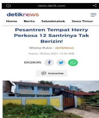
Gambar 1. 1