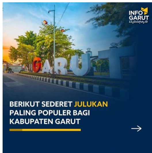
Gambar 1. 3 Sederet Julukan Paling Populer Bagi Kabupaten Garut.

Julukan Kota Garut pun juga terdapat dari salah satu platform media social instagram @Infogarut sebagai berikut: