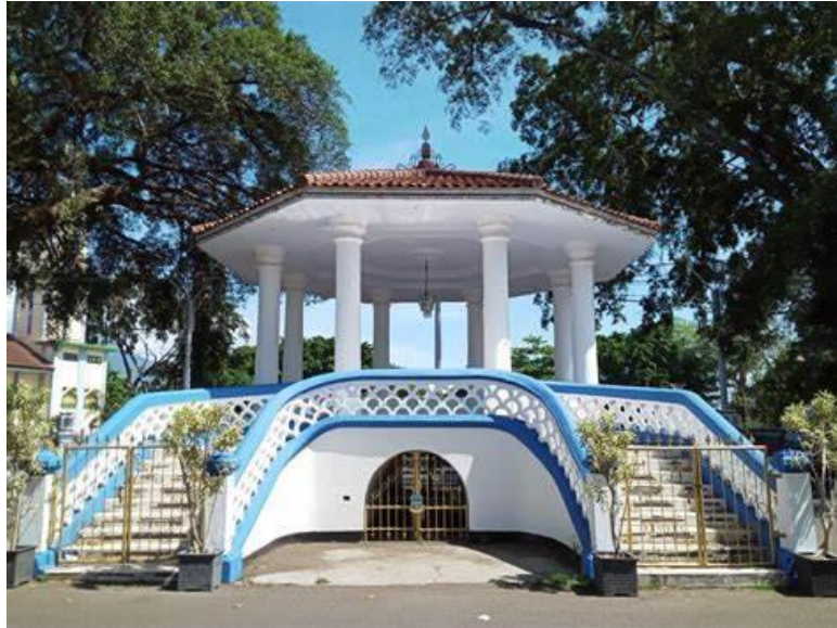
Gambar 1. 4 Babancong Kabupaten Garut

Gambar 1.4 Babancong Kabupaten Garut merupakan Icon dari julukan Garut sebagai Kota Intan. Hal ini telah di sepakati oleh Pemerintah Daerah Kabupaten Garut dan seluruh masyarakat Kabupaten Garut dari sejak kunjungan kedua Presiden pertama Indonesia Dr. Ir. H. Soekarno ke Kota Garut. Akan tetapi seiring dengan perkembangan zaman saat ini babancong sebagai Icon Garut Kota Intan ternyata tidak banyak orang mengetahuinya, mengingat percepatan media komunikasi yang sangat cepat sehingga banyak pihak yang mengunggah sejumlah informasi melalui social media terkait julukan Kota Garut lainnya. Hal ini menjadi populer sehingga membuat kebingungan bagi masyarakat Garut maupun masyarakat di luar Kota Garut sehingga tidak sedikit masyarakat yang bertanya-tanya apakah julukan yang sebenarnya Kota Garut itu (Warjita, 2007).