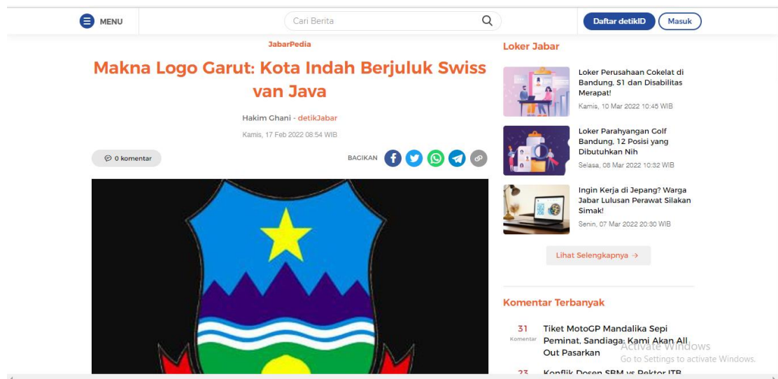
Gambar 1.1 Berita Julukan Kota Garut Sebagai Swiss Van Java

Adapun julukan lainnya terkait Kota Garut di temukan oleh peneliti melalui salah satu berita yang di tulis oleh platform berita online dari @detikjabar. @detikjabar merupakan salah satu platform Media berita yang menjadi referensi terpercaya bagi masyarakat karena platform Media berita @detikjabar ini selalu menyajikan dan menyampaikan segala informasi. Adapun salah satu berita yang saya kutip dari platform media berita @detikjabar adalah sebagai berikut: