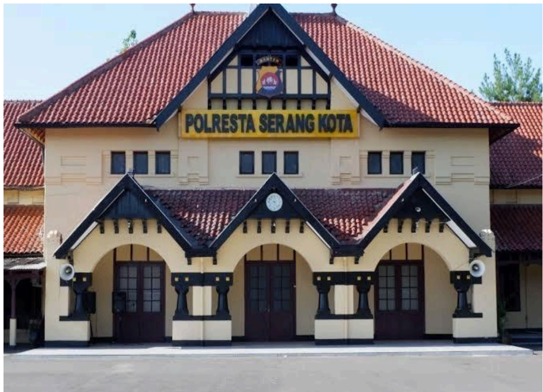
Gambar 3. 1 Polresta Serang Kota

Objek penelitian merupakan suatu gambaran dari sasaran penelitian yang kemudian akan dijelaskan guna mendapatkan informasi serta data untuk tujuan serta kegunaan tertentu. Disamping itu, pengertian objek penelitian menurut (Sugiyono, 2017) adalah sasaran ilmiah untuk mendapatkan data dengan tujuan serta kegunaan tertentu mengenai sesuatu hal yang objektif, valid, dan reliable terkait suatu hal.