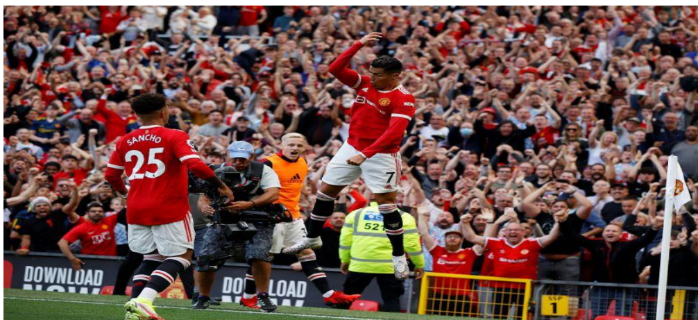
Gambar 1.1 Selebrasi Siuuu Cristiano Ronaldo

United yaitu Cristiano Ronaldo. Dalam selebrasi ini Ronaldo berlari ke pinggir lapangan kemudian melakukan loncatan. Ketika kedua kakinya sudah menginjak tanah, Ronaldo langsung melebarkan kedua tangannya sambil berteriak “Siuuu” dan di teruskan oleh teman-temannya serta para supporter. Selebrasi tersebut merupakan simbol dari kekuatan Ronaldo dan kehadirannya di lapangan serta ingin menunjukkan ke dunia bahwa dirinya adalah pemain yang terbaik. Selebrasi ini menjadi selebrasi ikonik milik Cristiano Ronaldo sampai banyak atlit-atlit lain dari kategori Olahraga yang berbeda menirukan selebrasi tersebut.