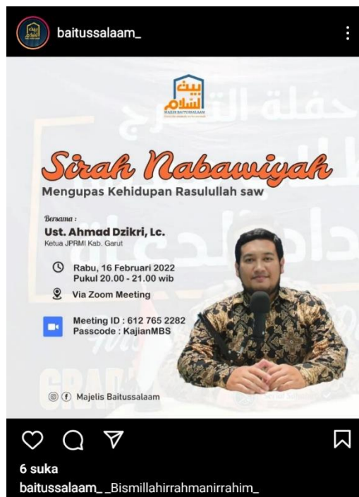
Gambar 1. 1 Ajakan kajian “Mengupas Kehidupan Rasulullah SAW”

Sejak tahun 2018 majelis Baitussalaam telah menugaskan para da'inya untuk menyebarkan ajaran-ajaran islam di Kota Garut. Dengan perkembangan pola dakwah yang berubah seiring dengan berkembangnya zaman para da'i diharapkan bisa mengikuti perkembangan tersebut upaya menjangkau seluruh lapisan masyarakat dalam berdakwah. Upaya mengikuti perkembangan serta perubahan dalam pola-pola komunikasi dakwah majelis Baitussalaam melakukan terobosan dalam melakukan aktivitas dakwahnya, salah satunya dakwah menggunakan media zoom meeting seperti pada gambar dibawah 1.1