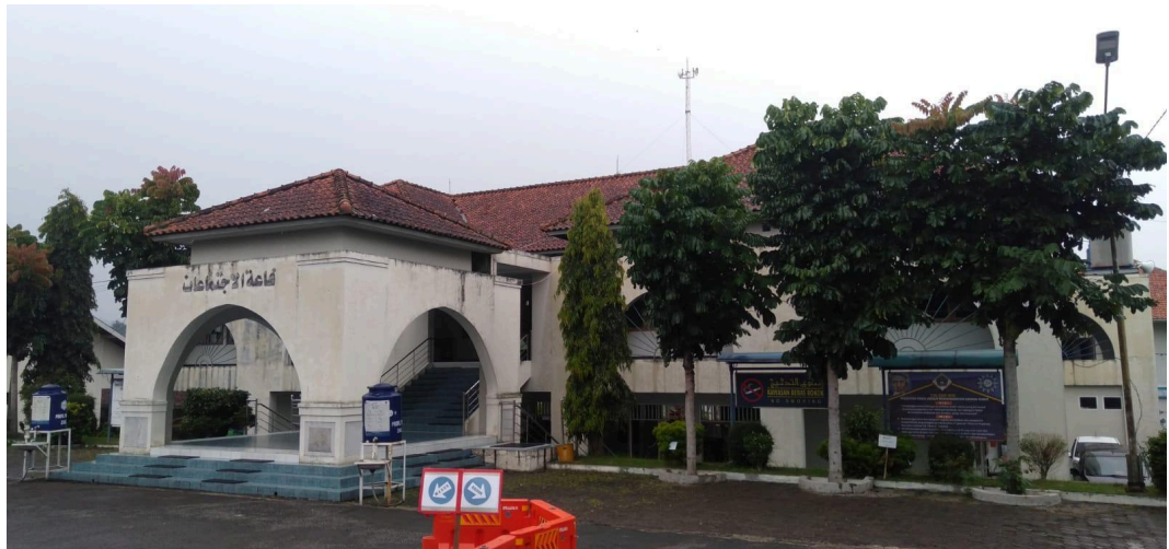
Gambar 3.1 Darul Arqam Muhammadiyah Garut