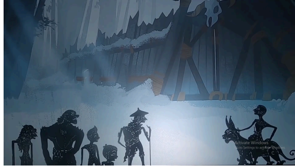
Gambar 3.1 Wayang

Berikut beberapa scene kebudayaan Indonesia yang nantinya akan peneliti analisis ialah wayang, membatik dan juga rumah gadang.