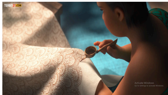
Gambar 3.2 Membatik

Berdasarkan pada gambar 3.1, menunjukkan scene film yang dimana ini merupakan salah satu unsur kebudayaan yang terdapat dalam salah satu adegan film. Pasalnya desain dari wayang Jawa yang terdapat dalam adegan tersebut di desain seorang komikus asal Indonesia yaitu Is Yuniarto.