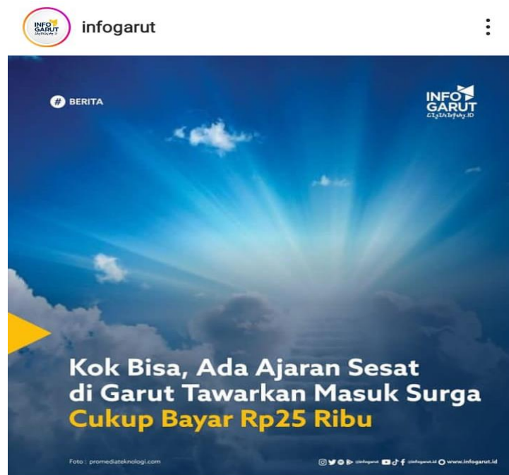
Gambar 1. 1Ajaran Sesat Di Kabupaten Garut Tawarkan Masuk Surga Cukup Bayar Rp25 Ribu

Berdasarkan pengamatan peneliti di lapangan yakni di Kabupaten Garut telah terjadi kasus ajaran sesat: