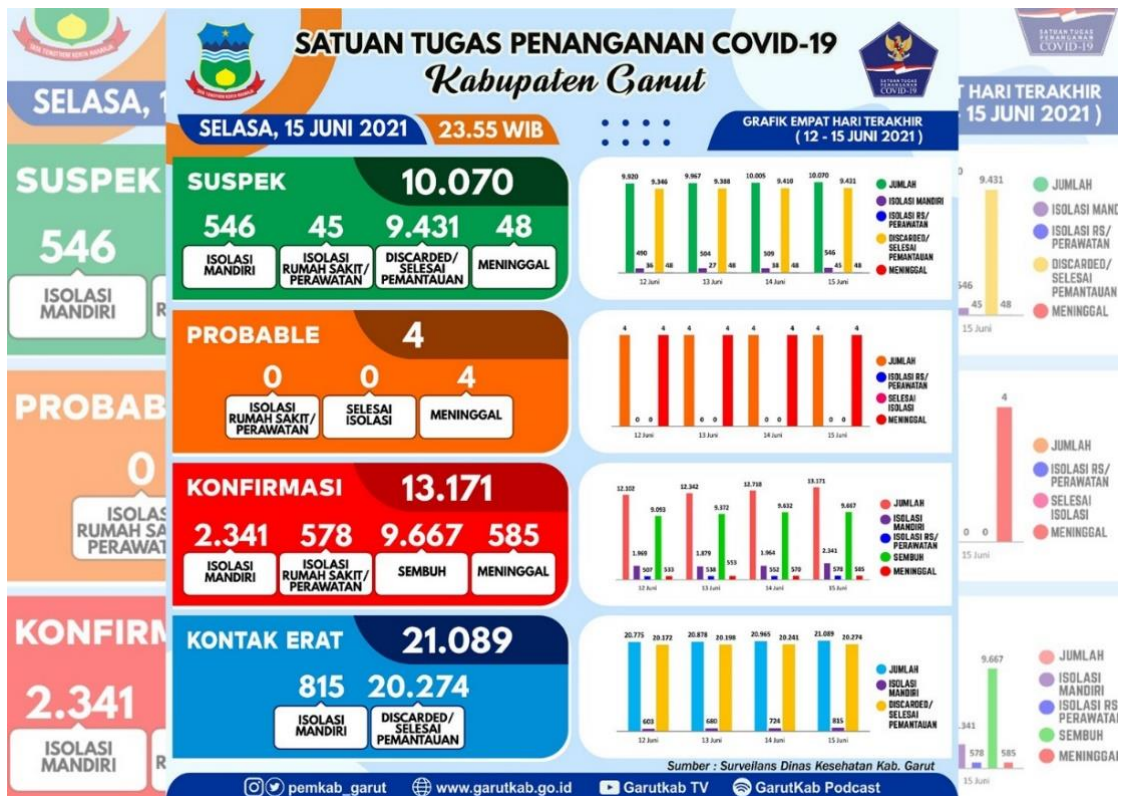
Gambar 1.1 Data Kasus Covid-19 di Kabupaten Garut

ini untuk menggali informasi lebih dalam terkait seperti apa pasien Covid-19 yang menjalankan isolasi mandiri dapat memaknai isolasi mandiri yang membatasi pergerakannya dan menjaga jarak dari keluarga atau orang sekitar.