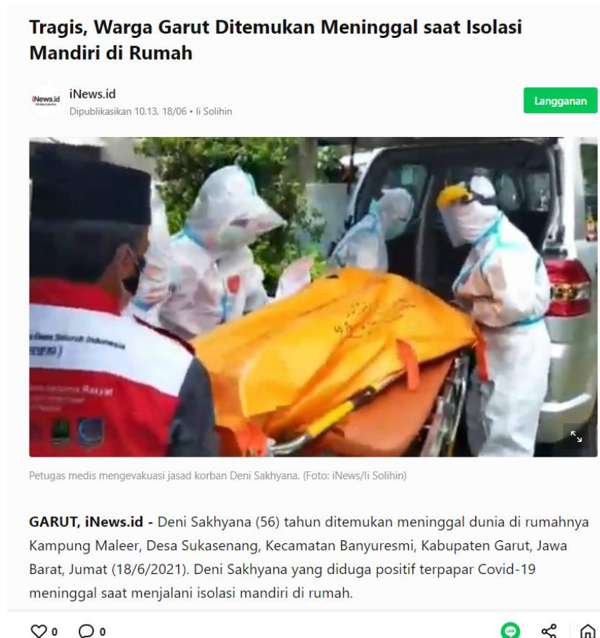
Gambar 1.5 Berita Pasien Covid-19 Meninggal Saat Isolasi Mandiri

Kondisi untuk mencapai ideal dari tingkat keterisian rumah sakit sulit di capai karena tingginya jumlah warga yang terpapar Covid-19 .