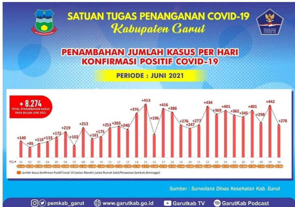
Gambar 1.2 Kasus Covid-19 di Kabupaten Garut

mandiri yaitu sebanyak 421 dan kasus isolasi di rumah sakit atau dalam perawatan sebanyak 152.