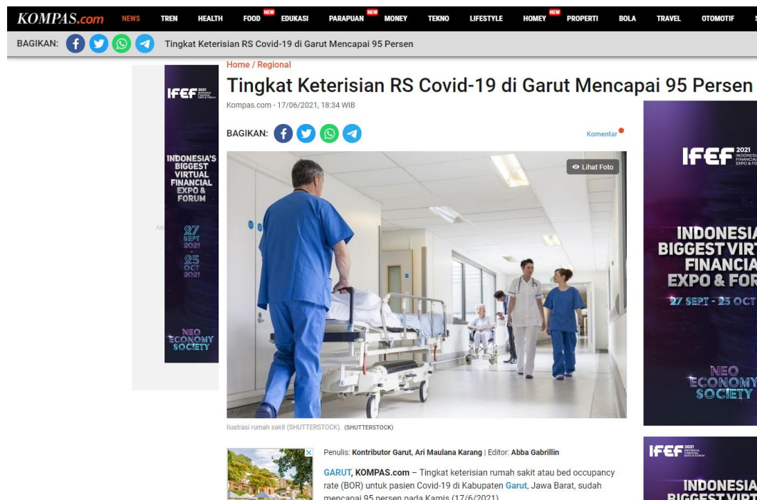
Gambar 1.4 Berita Kolapsnya Rumah Sakit di Kabupaten Garut

mandiri terbanyak bukan dalam kelompok umur lansia atau anak-anak, tetapi dari data tersebut bisa dilihat bahwa Covid-19 memang berbahaya dan rentan untuk lansia karena data yang meninggal akibat Covid-19 terbanyak dalam kelompok umur lansia atau diatas 60 tahun dengan persentase 38,5 persen.