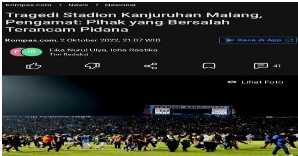
Gambar 1.1 Tampilan Berita dari Website Kompas.com