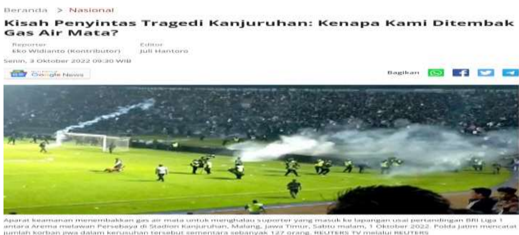
Gambar 1.2 Tampilan Berita Dari Website Tempo.co

Sedangkan di media online Tempo.co lebih ke humanisme memberikan informasi mengenai wawancara dengan korban yang selamat dalam tragedi stadion kanjuruhan malang dan mendeskripsikan dari sudut pandang korban yang berada di stadion tersebut saat kejadian terjadi.