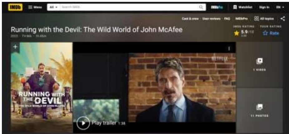
Gambar 1.1. Tangkapan Layar Rating Film Dokumenter Running with the Devil: The Wild World of John McAfee

McAfee, seorang milyarder asal Amerika Serikat yang merupakan pencipta perangkat antivirus bernama McAfee.