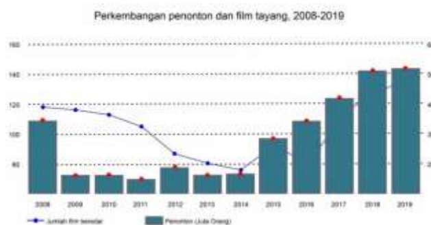
Grafik 1.1. Perkembangan Penonton dan Film Tahun 2008-2019